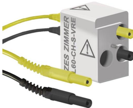
Abb. 2: Ansicht eines VRE-Adapters für S3-Kanäle

Auch aus Messgerätesicht erfordert die Verschiebung von AC zu DC-Anpassungen. Gerade bei grüner Energie sollten Wirkungsgrade und Verluste nicht außer Acht gelassen werden. Dabei sind die Kosten nicht der einzige Grund, Energieverschwendung zu vermeiden. Solange Ladestationen vergleichsweise dünn gesät sind und der Ladevorgang an Dauer das klassische Tanken überschreitet, hilft jeder zusätzliche Kilometer Reichweite, den Umstieg auf Elektromobilität attraktiver zu machen. Denn weiterhin gilt: je niedriger der Wirkungsgrad, desto mehr Abwärme, desto mehr leiden Zuverlässigkeit und Lebensdauer von Bauteilen und Produkten.