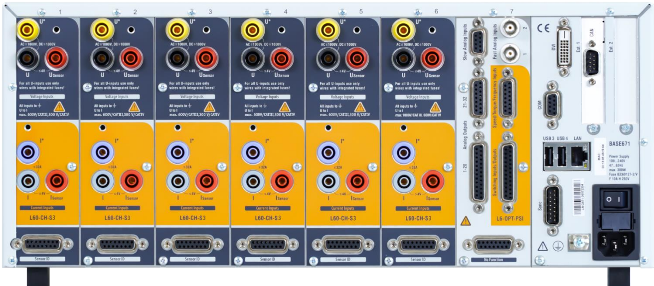
Abb. 2: Rückansicht eines LMG671 mit 6 S3-Kanälen